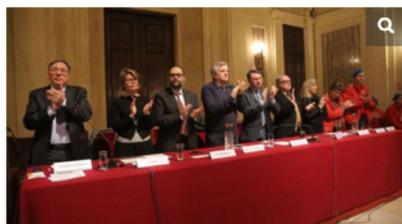
Il comitato del Panettone d'oro durante la cerimonia del 2 febbraio 2014

FOTO - PANETTONE D'ORO: I PREMIATI DELL'EDIZIONE 2014